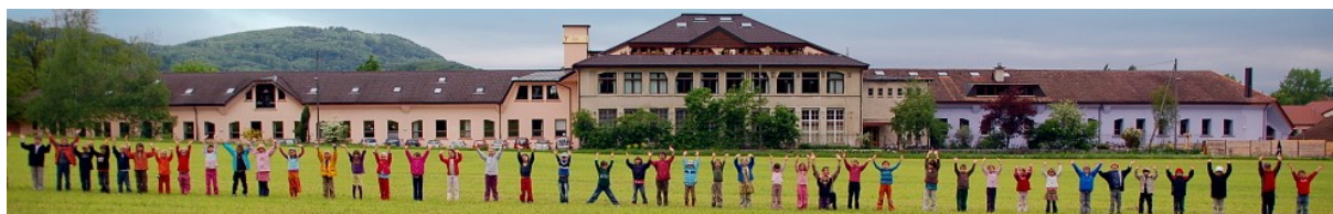
Rudolf Steiner Schule Birseck