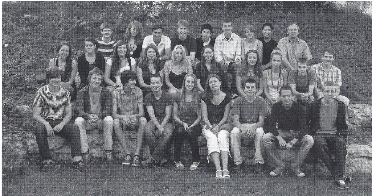
Spolužáci (fotka z loňského roku)

Ve škole jsem nenavštěvovala všechny předměty. Nechodila jsem na hodiny francouzského a anglického jazyka. Francouzštinu se v Praze neučím, je tedy logické, že jsem na ní nedocházela. Angličtina pro mě byla velmi náročná. Němčina i angličtina je pro mě cizí jazyk a bylo obtížné se mezi nimi přepínat. A navíc moji švýcarští spolužáci jsou v angličtině na vyšší úrovni. Za domácí úkol dostávali číst knihy a v hodinách z nich psali eseje. A to chtěli i po mě. Kdybych to tedy měla dělat, byla by to spíše anglická stáž, protože bych veškerý svůj volný čas trávila s angličtinou, abych alespoň částečně splnila požadované úkoly. Dále jsem také nechodila na odpolední semináře, které studenty připravují na maturitu. Místo všech hodin, které jsem nenavštěvovala, jsem se učila němčinu. Chodila jsem jednou týdně na soukromou hodinu němčiny a paní učitelka mi zadávala písemné úkoly, které jsem pak vypracovávala ve volných hodinách.