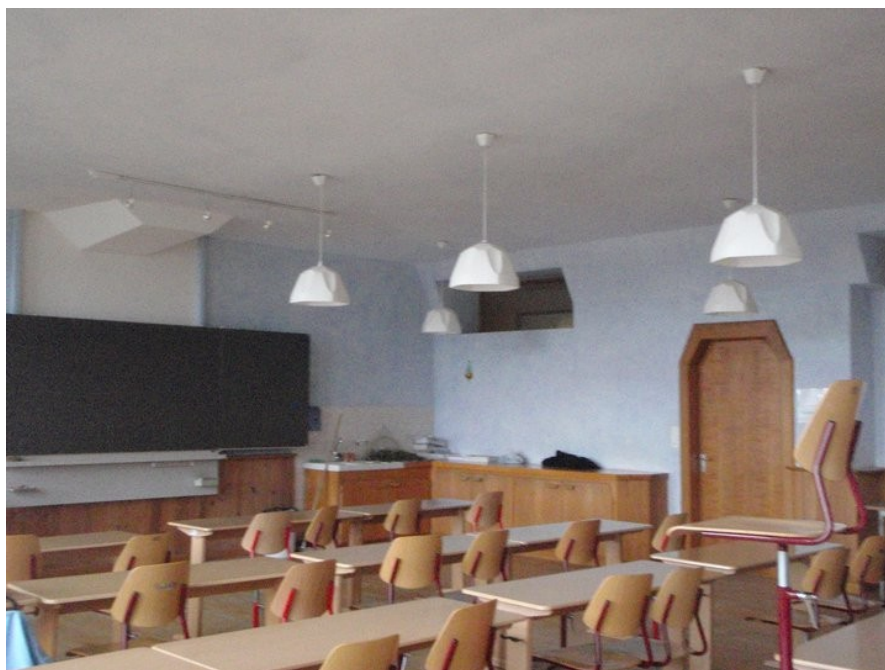
Třída odborných předmětů