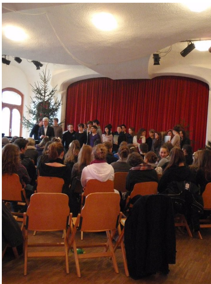
Vánoční slavnost v divadelním sále ve škole (já a má třída máme pěvecké představení)