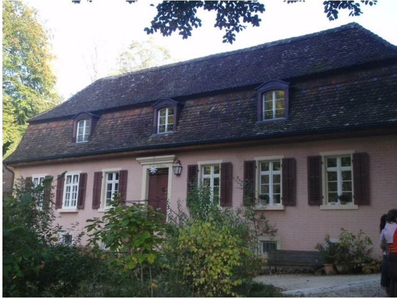
Dům mé ubytovávající rodiny