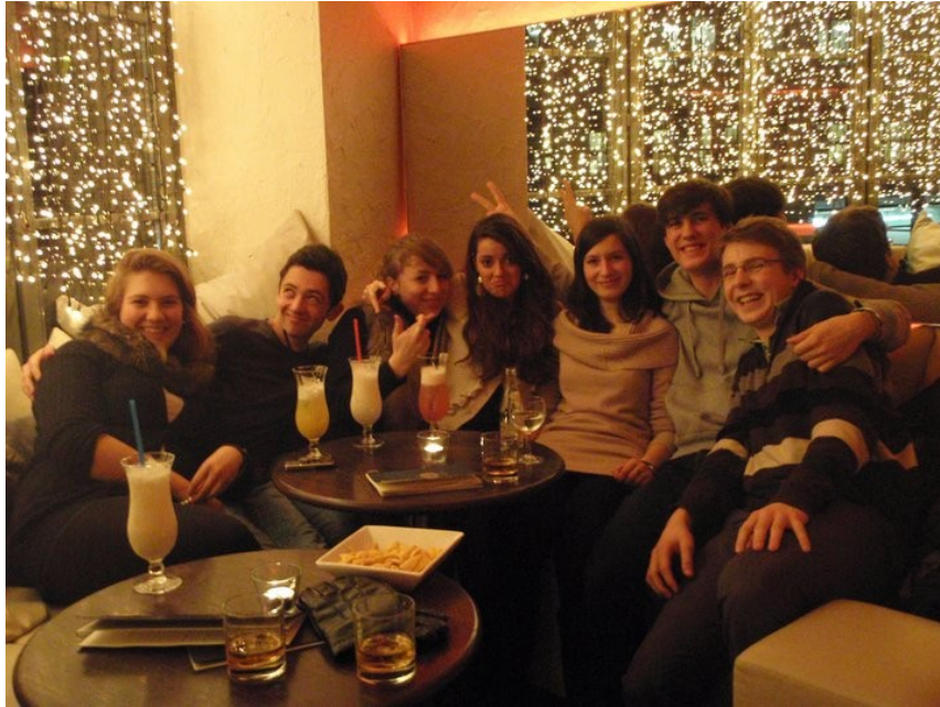
Párty se spolužáky