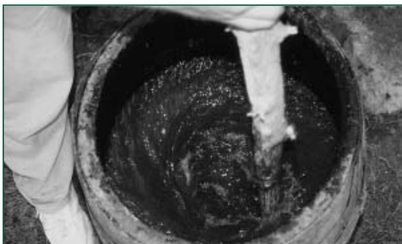
Míchání biodynamického preparátu roháčku

Před inseminací se dává přednost přirozené plemenitbě. V plemenářské práci se klade důraz na dlouhověkost a celoživotní užítkovost.