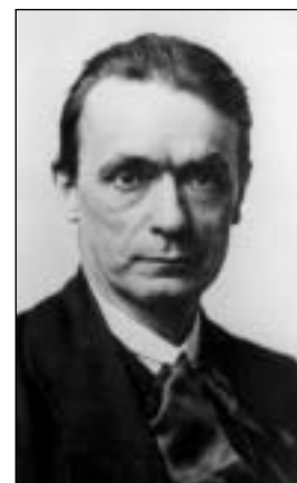
Zakladatelem byl Rudolf Steiner

S biodynamickým zemědělstvím se stále setkáváme a málo mu rozumíme – proto je mu věnována samostatná kapitola