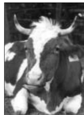
Rohaté krávy – do budoucna pouze v sada biodynamických statků?

Velký význam je připisován péči lidí o zvířata, každodennímu styku ošetřovatele s nimi; proto se na biodynamických farmách tolik neseznamujeme s celoročním pastevním chovem skotu s minimální lidskou péčí, jak je poměrně běžný v jiných systémech EZ.