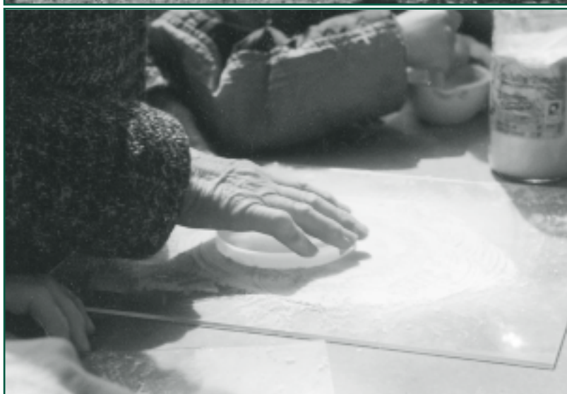
Příprava kfiemenného biodynamického preparátu

řada kritérií. Srovnání poskytuje švýcarský polní pokus DOK v němž jsou v Oberwilu od roku 1978 zkoumány tři systémy pěstování plodin: biologicko-dynamický (D), ekologický (O) a konvenční (K), vedle nich i kontrolní varianta. Pokus provádí Výzkumný ústav ekologického zemědělství ve Fricku (Švýcarsko). Srovnáván je nejen výnos, ale i vliv metody na ekosystém a také na kvalitu sklizených produktů.