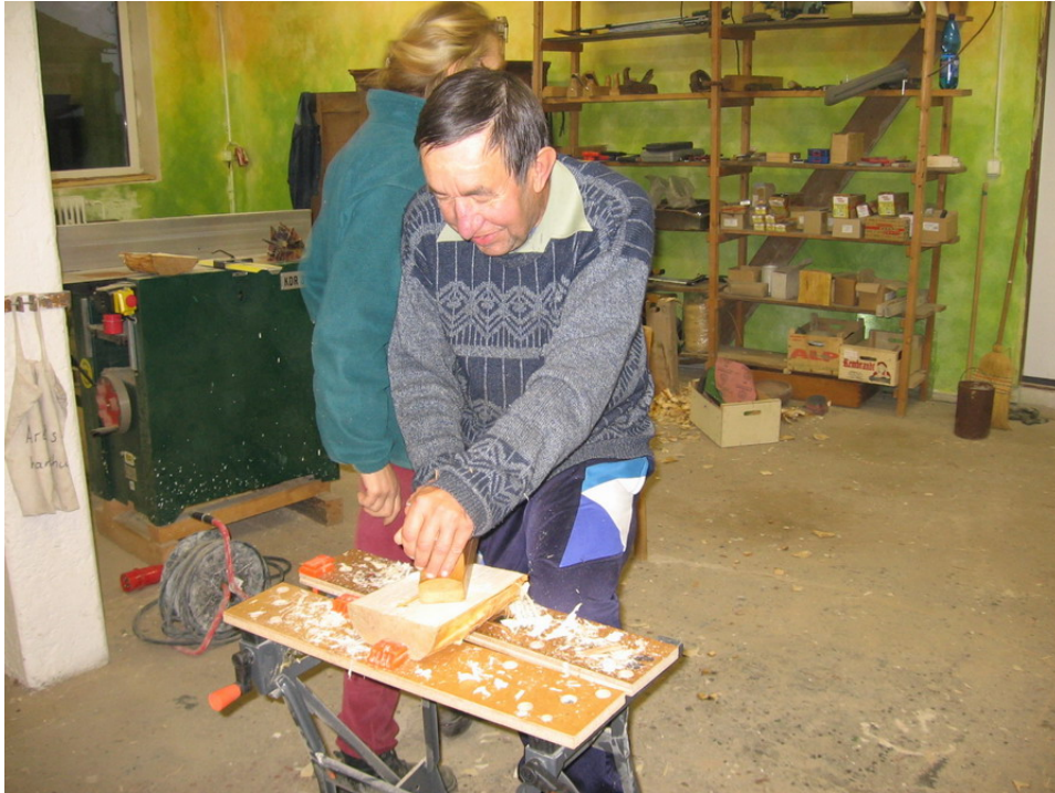
Obr.2 Klient Camphillu při práci v truhlářské dílně

Kromě toho funguje pěstování biozeleniny a bylinek a její distribuce do vybraných prodejen v Praze nebo dovoz na objednávku.