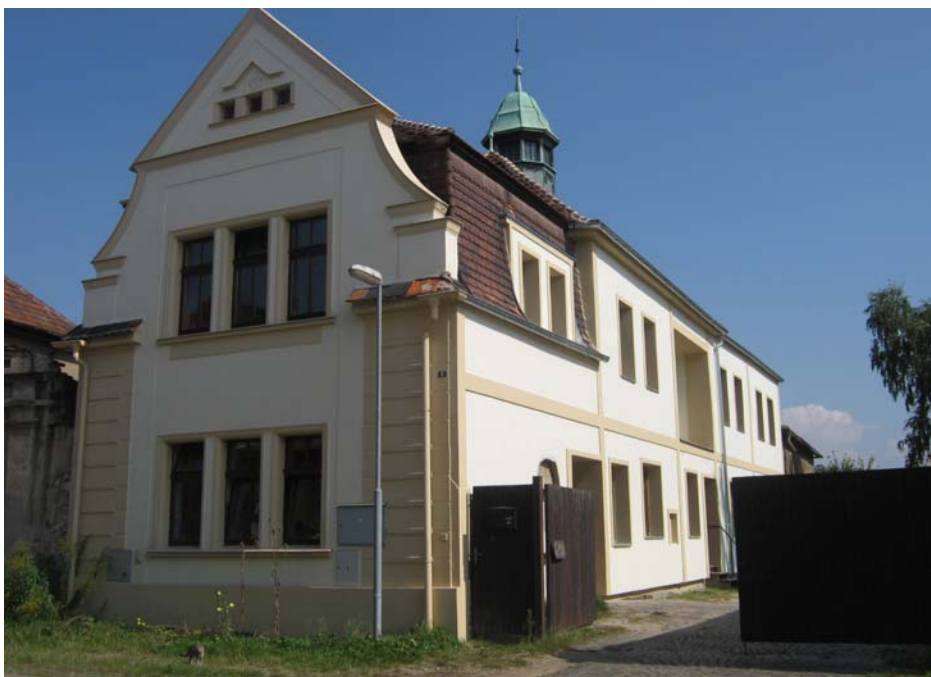
Obr. 7 Hlavní budova po rekonstrukci, září 2010