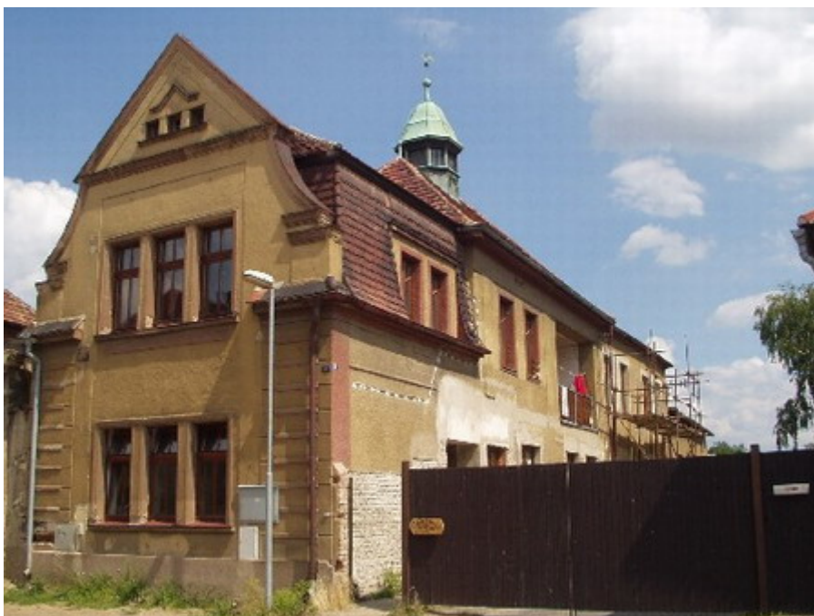
Obr.1 Hlavní obytná budova Camphillu během rekonstrukce stav v roce 2005

V květnu 2001 byla vypracována architektonická studie a stavební projekt na rekonstrukci usedlosti. O rok později byla rekonstrukce zahájena. Bohužel v srpnu 2002 byly objekty postiženy povodní (voda vystoupila do výše 1,7 m) a zničila vše, co se v jejím dosahu nacházelo, zanechala za sebou vrstvu bahna a vodou nasáklé zdivo. Následky povodně byly odstraňovány na podzim 2002 a na jaře 2003 za pomoci dobrovolníků - odklízeli poškozené věci, sušili a umývali, čistili a desinfikovali, osekávali omítku a vysoušeli zdivo.