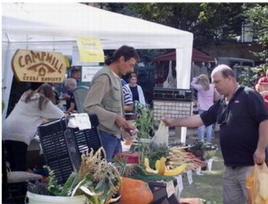
Obr.3 Prezentace Camphillu na výstavě Zahrada Čech

Camphillské komunity nejsou zatím v naší republice obecně známým pojmem, bude jistě trvat dalších několik let, než se tak stane. Proto se zakladatelé velmi snaží zveřejnit co největší množství informací o činnosti komunity. Zřídili k tomu účelu velmi dobře vedené a pravidelně aktualizované internetové stránky na adrese www.camphill.cz . Zde se zájemce dočte všechny potřebné informace jak o fungování camphillu, tak o poskytování služeb, financování, členech občanského sdružení a různých akcích, které camphill pořádá.