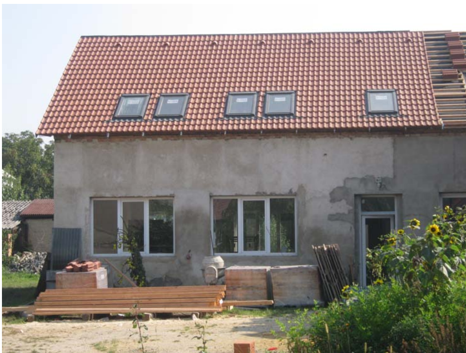
Obr. 9 Rozestavěný objekt dílen s novou ubytovací kapacitou v podkroví, stav v září 2010