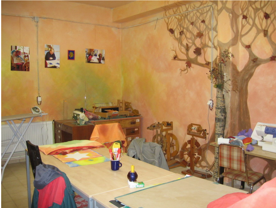
Obr.6 Výtvarná a textilní dílna v Camphillu