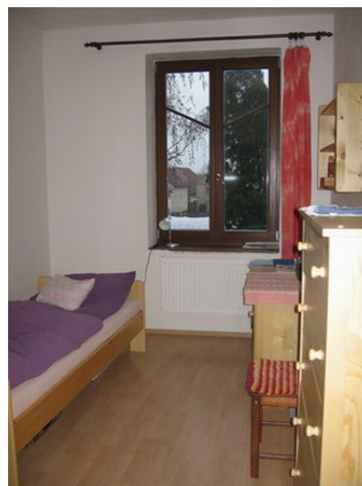
Obr4 Klientský pokoj v hlavní budově

byl v návrhu spíše oživen původní vesnický charakter zástavby celého statku s pravidelnými sedlovými střechami na domech, situovaných po obvodu dvora. Hlavní statek je využit pro bydlení rodin, pro dílny a pracovny, v zachované jídelně bude zřízen sál komunitního centra. K tomuto pozemku je ještě k dispozici další pozemek o dva statky blíže k nedaleko tekoucímu Labi, na kterém by měla stát část farmy s využitím přilehlých ploch pro zelenářskou zahradu.