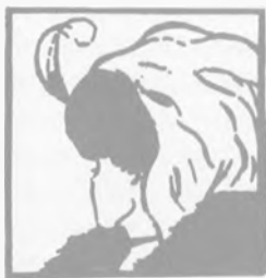
Stařena, nebo mladá dívka?