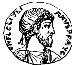
Minca s portrétom Juliána Apostatu

Maximus mu však prikázal, aby sa v Grécku zúčastnil ešte aj eleuzínskych mystérií a tam zdokonalil svoje zasvätenie. V lete 335 mu hierofant v Eleusine v dlhých rozhovoroch vysvetľoval význam rozmanitej symboliky; a 28. septembra sa nastávajúci regent Galie zúčastnil na veľkých slávnostiach bohyne Demeter , kde išlo o smrť a zmŕtvychvstanie v rúchu prírodného mýtu, ktorý vyvrcholil volaním: "Persefóné porodila syna...". V tejto kultovej forme sa vyjadroval zrod ľudského ja v duši žiaka , čo malo viesť k posilneniu a premene jeho osobnosti. Ako sa Julián neskôr vyjadril, nebol