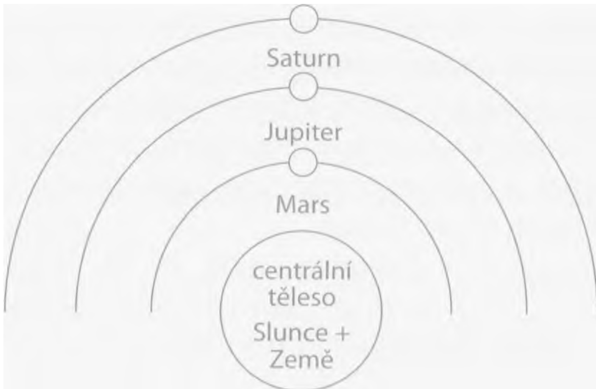
Obr. 4: Tvoření sluneční soustavy

Tři vrstvy Slunce, kosmického Já, se rozprostírají až k oběžné dráze Venuše (Venuše, Merkur a Slunce), neboť ve světle okultní kosmologie byly původně jedním tělesem. Po svém oddělení od centrálního tělesa se Měsíc a Země staly jednotným tělesem. Před tímto oddělením byly Slunce, Merkur, Venuše, Měsíc a Země dokonce navzájem spojeny do jednoho centrálního