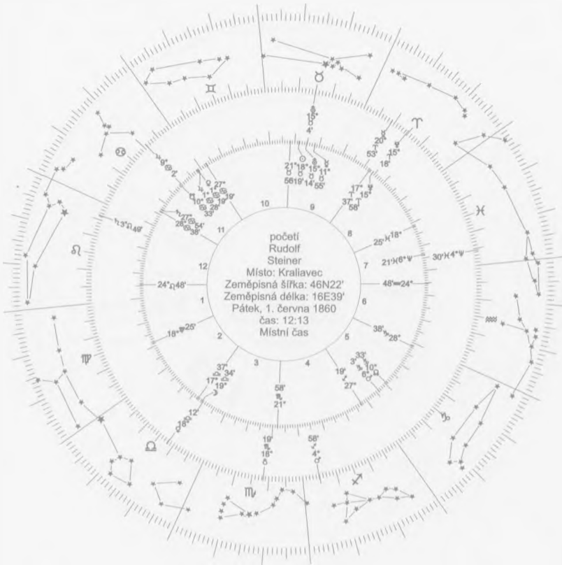
Rudolf Steiner - početí