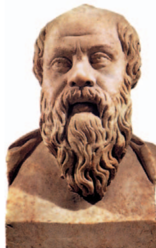
Sokrates (469-399 pr. Kr.).

Poslednýkrát sa zhromaždili Sokratovi žiaci okolo svojho učiteľa vo väzení. Kým zriadenec väznice miešal jed, Sokrates podáva v dialógu dôkaz nesmrteľnosti duše. Prirovnáva sám seba k „ labutiam, Apollónovým vtákom, ktoré keď cítia, že musia zomrieť, vtedy spievajú najviac a najkrajšie z radosti nad tým, že majú odísť k bohu, ktorého sú služobnicami... A ja sám si o sebe myslím, že