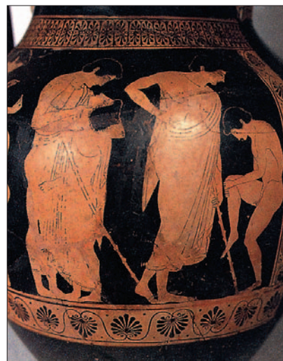
Červenofigúrový sloh, po r. 525 pr. Kr.

Prechod od čiernofigúrového k červenofigúrovému slohu v keramickej výzdobe v Grécku v 6. storočí pr. Kr. je obrazom vzniku ľudského svedomia. A to zase nie je nič iné ako to, čo v rovnakom čase hlása v Izraeli prorok Jeremiáš (627-586 pr. Kr.): príde čas, keď Boh uzavrie s ľuďmi novú zmluvu; keď zákon nebude už napísaný len na doskách vonku, ale v srdci človeka: „ Hľa, príde dni... keď uzavriem s domom Izraela a s domom Júdu novú zmluvu... Zákon svoj dám do ich vnútra a napíšem ho do ich srdca “. (Jer 31:31-33)