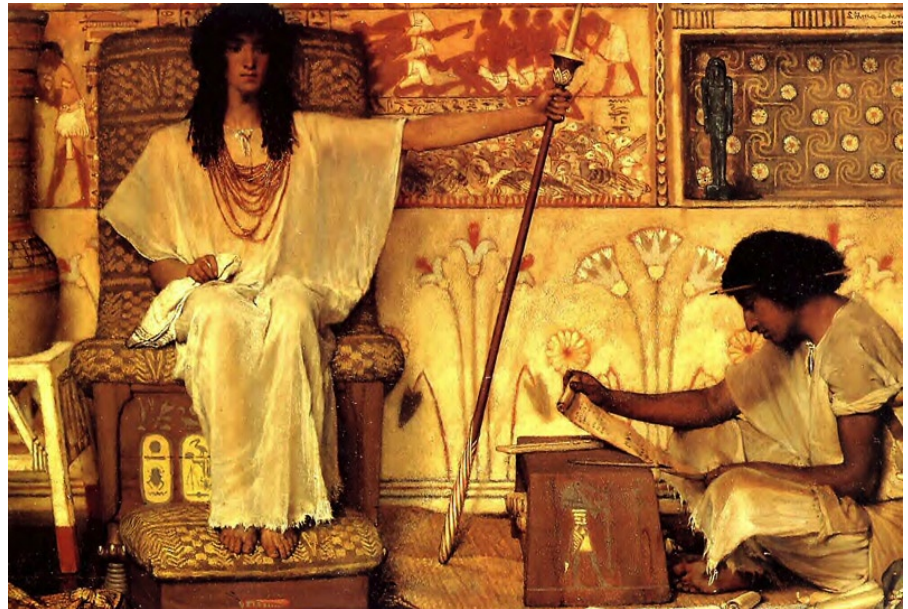
Lawrence Alma-Tadema: Správca faraónových sýpok