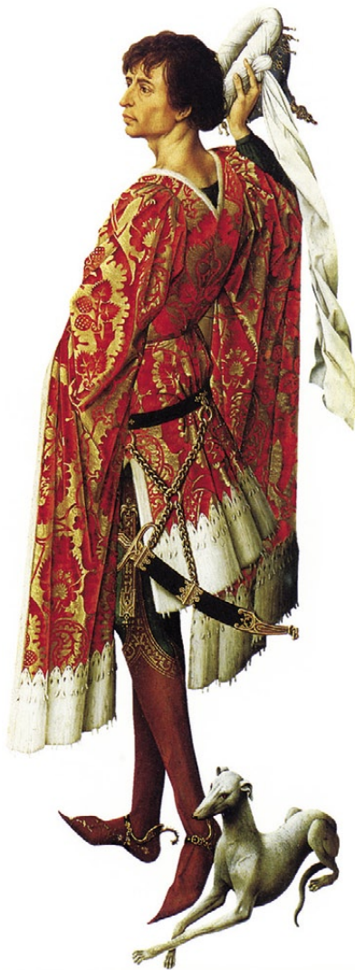
Karol Smelý (1433-1477)

Babylončania neboli jediní, kto si to uvedomoval. Keď Herodotos navštívil Egypt, dozvedel sa od tamjších kňazov, že aj Egypťania veria,