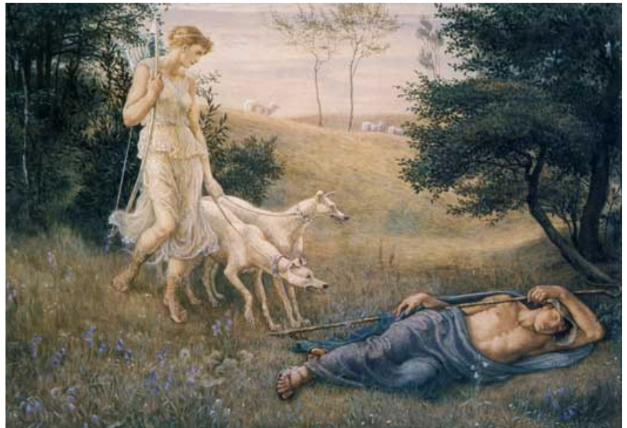
Walter Crane: Diana a Endymion

Vezmime si grécku báj o Endymionovi. Milenec bohyne Mesiaca získa večnú mladosť, ale je aj odsúdený na večný spánok. V tejto báji je zašifrovaný biochemický poznatok. Striebro, ktoré sa tradične považovalo za „slzy“