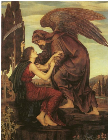
Evelyn de Morgan: Anjel smrti

Ako k tomu došli? Temný vek staroveku, čas trójskej vojny, kedy celý staroveký Predný východ podľahol zmätkom a úpadku (12. storočie pr. n.l.) si vysvetľovali tak, že Nergal sa dočasne zmocnil vlády nad svetom. Zničenie Akkadu spadá do 22. storočia, zánik Starobabylonskej ríše do 17.