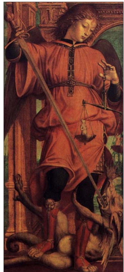
Bernardino Zenale: Sv. Michal, 15. stor.