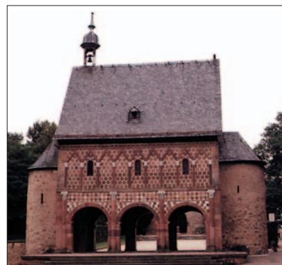
Karolínska architektúra. Vstupná brána opátstva v Lorschi, koniec 8. stor.

Zároveň vzniká druhý typ stavby - niková rotunda - centrálne orientovaná, s vencovito usporiadanými výklenkami, pripomínajúca javorový list. Vzorom pre tento typ sa stali chrám San Vitale v Ravenne z rokov 522-547 a palácová kaplnka Karola Veľkého v Aachene (786-800). K tomuto typu patrí aj „ pôdorys gréckeho kríža, ktorý je najpôvodnejším vynálezom byzantského staviteľstva a jeho typickým prejavom “. 243