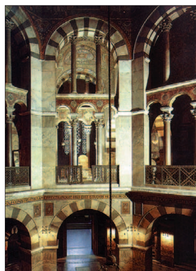
Palácová kaplnka v Aachene, 710-804.