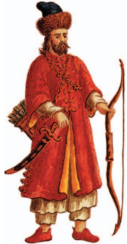
Marco Polo, 18. stor.

S nástupom archanjela Michaela po roku 1879 sa zemeguľa opäť skokom zmrštila. Posledné kultúry na Ďalekom východe, ktoré sa izolovali, ako Čína, Tibet, Japonsko, sa otvorili vplyvu západnej kultúry; a Západ sa stal vnímavým pre duchovné poklady Orientu. Áno, aj úlohou tohto michaelského obdobia je, aby sa duch Západu a Východu vlievali jeden do