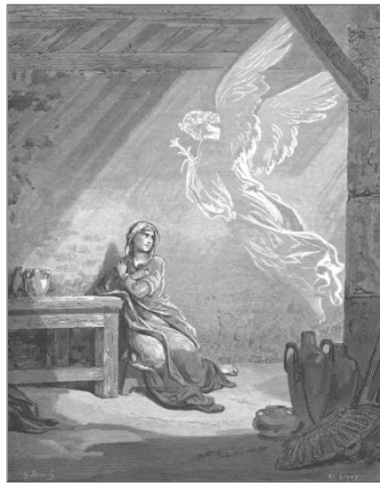
ZVESTOVANIE. SILY ARCHANJELA GABRIELA PÔSOBIA PRI KAŽDOM POČATÍ A NARODENÍ, PRI KAŽDOM ZOSTUPE DUŠE NA ZEM.

Tolko tradícia. Čo by sme o Gabrielovi povedali my dnes? V kozme skutočne existujú dva veľké duchovné prúdy: jeden vzostupný a druhý zostupný. Jeden prúd, ktorého "nosnou vlnou" sú sily Mesiaca, a ktorý takpovediac vŕhne duševnosť do hmoty ; a druhý prúd, ktorý naopak dušu z hmoty vyslobodzuje, povznáša k Duchu , a ktorého "nosnou vlnou" sú sily