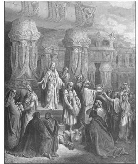
PERZSKÝ KRÁĽ KÝROS, INŠPIROVANÝ ARCHANJELOM MICHAELOM, VRACIA POSVÄTNÉ NÁDOBY ŽIDOM.

Okolo r. 1000 pr. Kr. sa Izraelcom konečne začína dať: Prvý izraelský kráľ, Saul, vedie víťazné vojny proti Filištincom, Moábcom, Amalekovcom, Aramejcom, Edómcom... a vytýči hranice izraelského kráľovstva. Teraz prichádza čas vlády najslávnejších židovských kráľov: Dávida a Šalamúna. Kráľovské knihy vykresľujú kráľovstvo na vrchole Šalamúnovej vlády: “Júda a Izrael boli takí početní, ako piesok na brehu mora. Mali čo jesť a piť a radovali sa. Šalamún vládol nad všetkými kráľovstvami od rieky Eufratu až po zem Filištinov a až k hraniciam Egypta; odtiaľ prinášali Šalamúnovi dary a slúžili mu po všetky dni jeho života... Panoval nad celým územím na západ od rieky Tifsachu až ku Gaze, nad všetkými