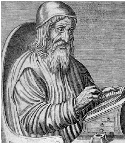
JOHANNES TRITHEMIUS ZO SPON-HEIMU. VO SVOJEJ KNIHE VYSVETLUJE SYSTÉM KOLOBEHU ČASU A PORADIE, V AKOM HO ARCHANJELI RIADIA.

ladení na určitú spoločnú duševnú vlnu; žijú pre určité veci, ktorým prikladajú význam. To pochádza z toho, že rôzne miesta na povrchu Zeme skutočne nie sú rovnaké, ale sú spojené s rôznymi duchovnými silami z kozmu. Videné jasnovidne je každé miesto akoby zahalené oblakom inej duševnej kvality, farby.