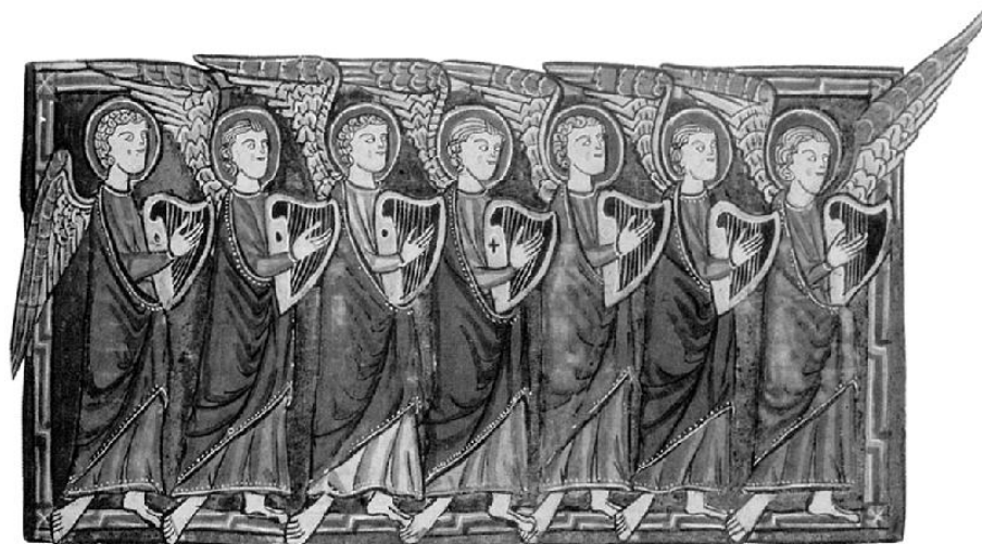
SEDEM ARCHANJELOV PREDSTAVUJE SEDEM TRITHEMIOVÝCH CYKLICKÝCH VEKOV.

**Pozri: Zdeněk Váňa: Stvoření svě- ta a člověka v poznání duchovní vědy. Sophia 14, 1997.