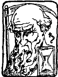
SATURN, KRONOS JE PÁN ČASU. ÚLOHOU SATURNA JE VYMEDZENIE ČASOVÝCH RYTMOV V SLNEČNEJ SÚSTAVE.

A prečo práve 354 rokov a 4 mesiace? Nevieme. Ale začíname tušiť súvislosti, keď urobíme nasledovné pozorovanie: Medzi obežnými dobami Mesiaca a Saturna existuje pozoruhodná číselná zhoda. Mesiac obehne okolo Zeme za 29\frac{1}{2} dňa; Saturn okolo Slnka za 29\frac{1}{2} roka.* Saturnu trvá presne 354 rokov, kým obehne okolo Slnka dvanásť krát. Tak, ako dvanásť mesiacov naplní jeden slnečný rok, tak dvanásť "saturnských mesiacov" tvorí niečo ako "saturnský rok".