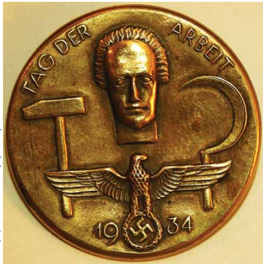
Prvomájový odznak z roku 1934 pripomína spoločné korene nacizmu a komunizmu.