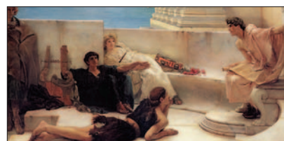
Lawrence Alma-Tadema: Čítanie z Homéra, 1885.