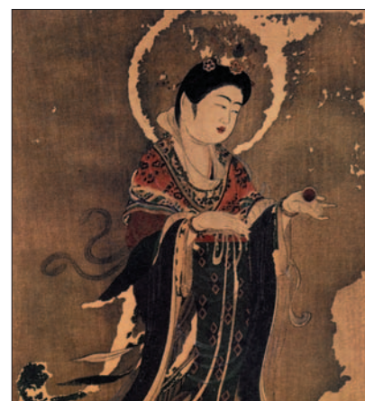
Personifikácia krásy, 8. stor.