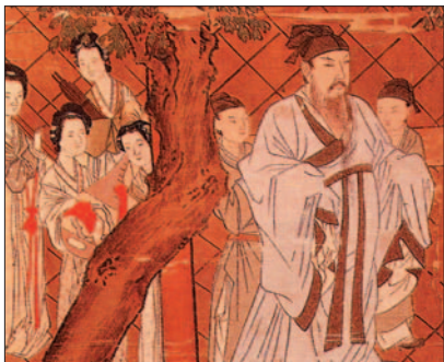
Básnik Li-Po v záhrade s broskyňami, 16. stor.