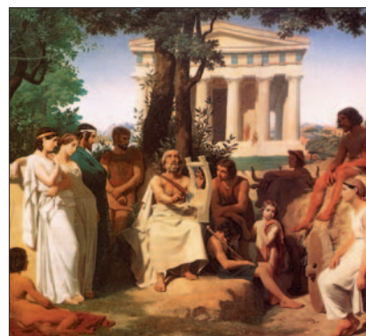
Homér. Slepý básnik spieva eposy o hrdinoch trójskej vojny. Maľba z 19. stor.

Klasickou japonskou poetickou formou je tanka . Tanka prežila podľa Kroebera tri vrcholné obdobia: Prvou a najväčšou kulmináciou bolo 8. storočie; a potom dve menšie renesancie okolo roku 1200 a 1800. Prvé z týchto období je teda súčasné so zlatým vekom čínskej poézie; a ďalšie