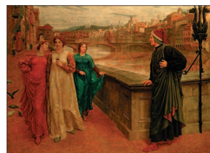
Henry Holiday: Dante a Beatrice.

dve zodpovedajú anaelským obdobiam 1197-1269 a 1773-1845! Klasická čínska a japonská poézia pulzovali po celých tritisíc rokov v rytme anaelského ducha času!