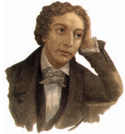
William Wordsworth (1770-1850).

Posledným príkladom veľkej poézie, ktorá nemá žiadnu paralelu v čase, je aiolská lyrika.