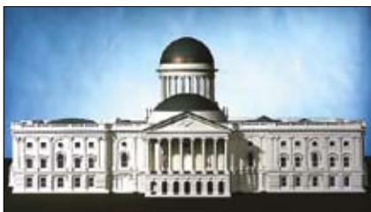
Pôvodný projekt Kapitolu.