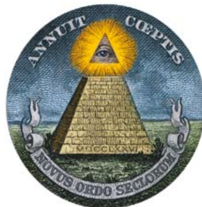
Veľká pečať USA (od roku 1782).

Orifielské premeny sa dotknú celého sveta (aj Európskej únii hrozí premena na centralizovaný monolit). No v Augustovej ére to boli predovšetkým dve vyslovene saturnské ríše, ktoré si podmaňovali svet zo západu a z východu: Rím a Čína. Bude to tak aj teraz? Po roku 2050 Čína dobehne Spojené štáty a stane sa hospodárskou veľmocou číslo jeden.