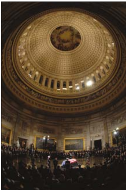
Slávnosť v kupole Kapitolu.