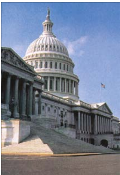
Kapitol Spojených štátov.

Spojené štáty sa podľa všetkého nachádzajú práve v tejto fáze prechodu k faktickej monarchii pod rúškom zdanlivej demokracie. V kabinete amerického prezidenta sa rozhoduje o celom svete, aj o nás, ale nás do toho nič nie je. Prvý muž Ameriky vystupuje ako cisár sveta, ale volí ho smú len Američania. Takto aj rímsky cisár diktoval podmienky provinčným krajinám, ale volebné právo zostalo vyhradené len Rimanom v Itálii. Obyvatelia provincií si na rímske občianstvo počkali 300 rokov.