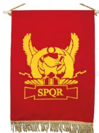
Orol na štandarde rímskych légii.