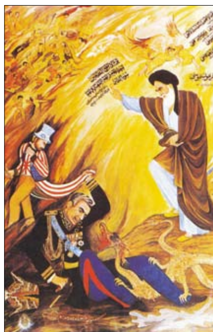
Ajatolláh Chomejní vílazi nad bábkovým šachom, ktorý sa drží šosov amerického imperializmu. Plagát iránskej revolúcie, 1979.