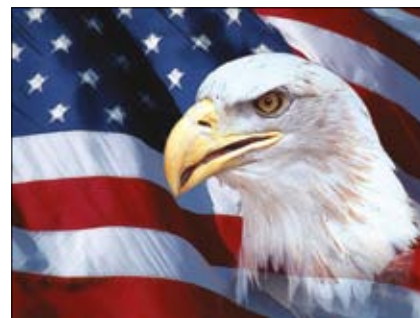
Americký orol a zástava.

Moc je najťažšia charakterová skúška a mení toho, kto ju získal. Súčasne s tým, ako sa Rím stal impériom, zmenil sa z republiky na cisárstvo. Obrovské provincie neboli demokratické, a kto im vládol, skorumpoval svojou mocou a bohatstvom aj samotný Rím. Senátori sa stali bábkami v rukách vojvodcov ako Marius či Caesar a veľkých boháčov ako Pompeius či Crassus. Cisári však udržiavali zdanie republikánskych inštitúcií ešte dlho potom, čo už rozhodovali celkom sami.