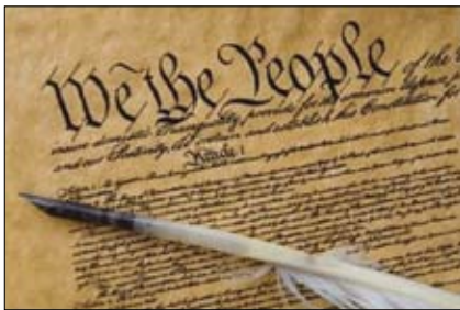
Ústava Spojených štátov amerických.