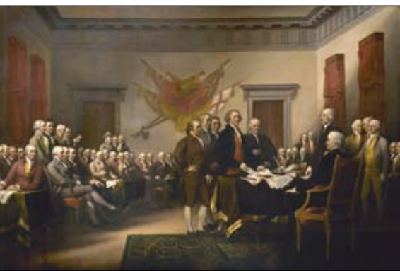
Deklarácia nezávislosti (1776).