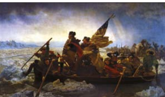
Emanuel Gottlieb Leutze: Washington prekračuje rieku Delaware, 1851.