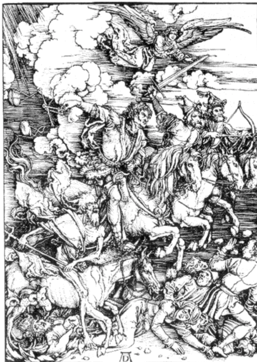
A. Dürer: APOKALYPTIČTÍ JEZDCI