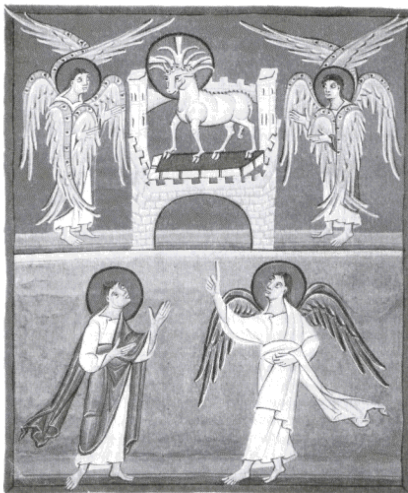
BERÁNEK. Bammerská apokalypsa