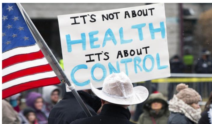
Z demonstrace proti vládním opatřením v Idahu (USA) 25. prosince 2020.

měsíců před vypuknutím pandemie, byly v Bangladéši zahájeny testy „systémů digitální identity“, spojené se stavem očkování dané osoby. Doufalo se, že doloží, jak lze „využít imunizaci jako příležitost k zavedení digitální identity“ v celosvětovém měřítku.