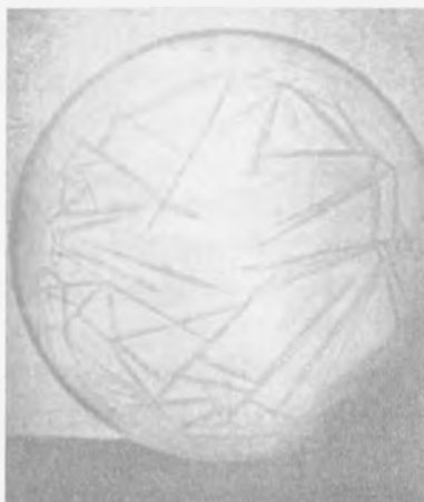
Obrázek 65 Krystalizační obraz strídy

Utvářející síly v chlebu Krystalizační série s dusičnanem draselným (srovnej s kontrolní krystalizací obr. 55)