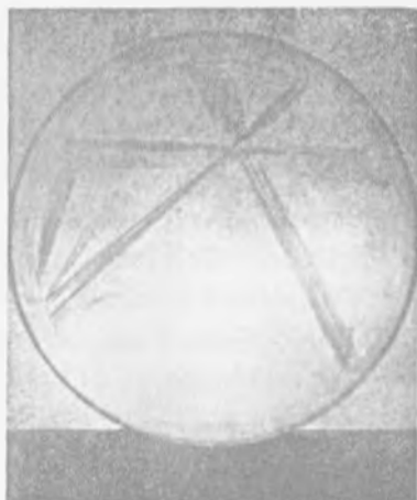
Obrázek 66 Krystalizační obraz kůrky