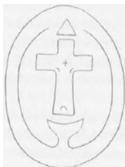
Symbol řečového organismu

To, co má ruka dělá, vidím tak objektivně, jakoby to byla skála hory utržená a padající do hloubky. Tak nahlížím na své skutky."