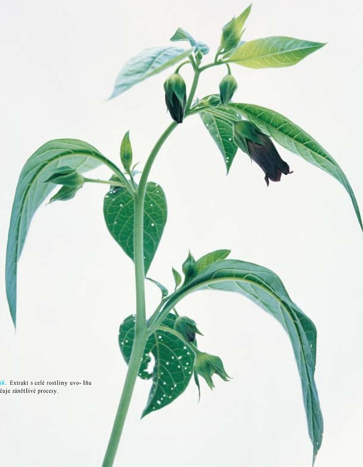
Belladonna, Rulík. Extrakt s celé rostliny uvo- lňuje je spasmy a potlačuje zánětlivé procesy.