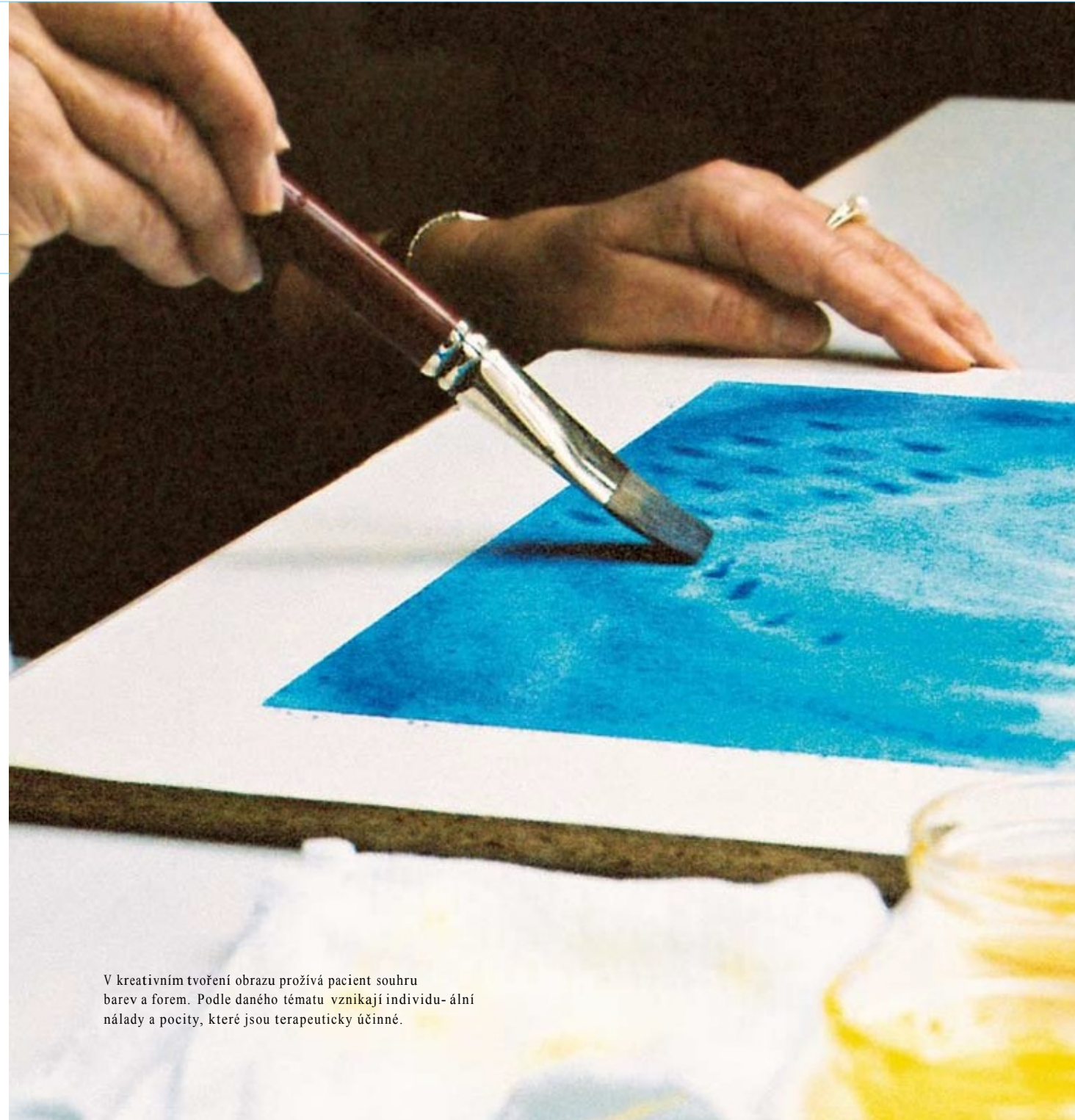
V kreativním tvoření obrazu prožívá pacient souhru barev a forem. Podle daného tématu vznikají individuální nálady a pocity, které jsou terapeuticky účinné.

Již v roce 1921 vznikly v Arlesheimu u Basileje (Švýcarsko) a ve Stuttgartu (Německo) první, tenkrát ještě velmi skromné, kliniky, ve kterých se nový lékařský způsob uváděl