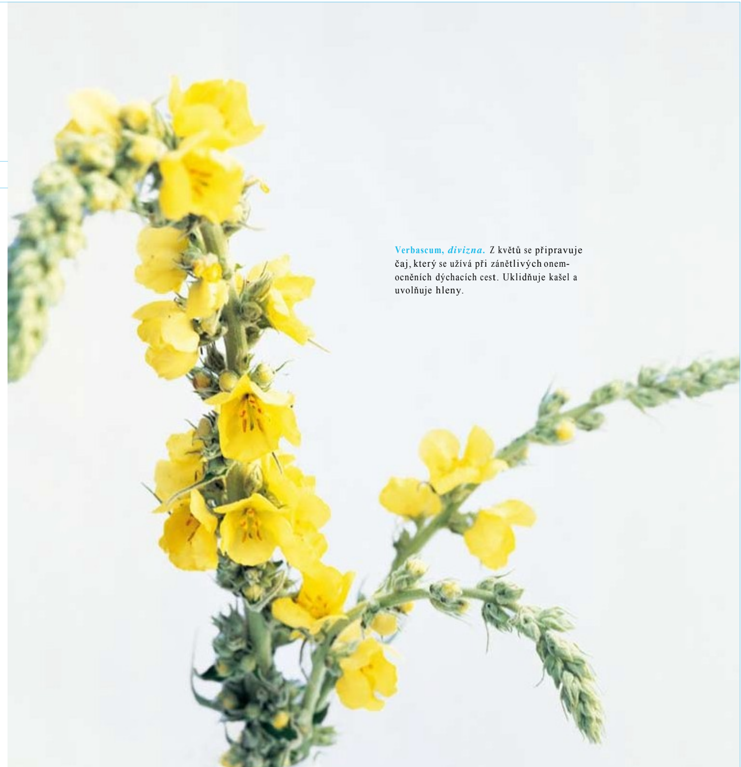
Verbascum, divizna. Z květů se připravuje čaj, který se užívá při zánětlivých onemocněních dýchacích cest. Uklidňuje kašel a uvolňuje hleny.

Nemocí se dostává člověku možnost, rozpoznat narušenou rovnováhu, ze které se tělem i duší vychýlil. Dostává šanci pochopit výchylku a pomocí terapie najít opět novou rovnováhu, často na vyšší úrovni. Chronické onemocnění mu nabízí možnost, naučit se nové schopnosti, nové způsoby jednání a dávat naší osobnosti možnost zrát. Antroposofický lékař podporuje svého pacienta právě tímto směrem. Posiluje jeho zodpovědnost za sebe, uznává jeho svéprávnost, podporuje jeho právo na rozhodování při volbě terapie, a posiluje ho v jeho snaze udržet si své zdraví.