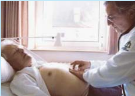
Při prohmatání břicha (vlevo) jsou zjištěné nálezy ověřeny pomocí vyšetření ultrazvukem (vpravo) a doplňovány.