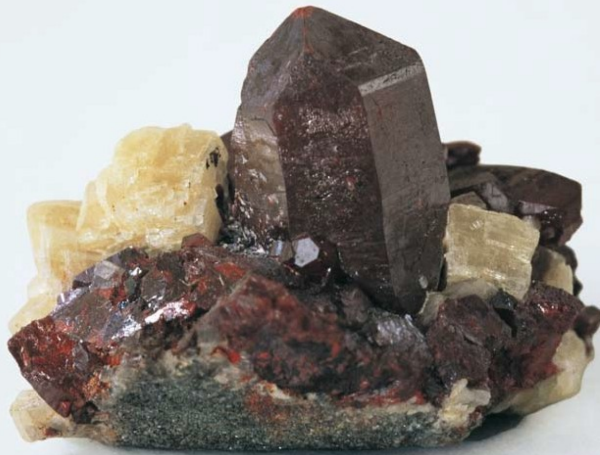
Rumělka. Minerál, který se používá jako prášek v tabletách, jež se užívají při akutních a chronických zánětech horních cest dýchacích.

Mimo to se používají i prostředky, které jsou komponovány pro specifická onemocnění, jejichž složení se orientuje podle zákonitostí vládnoucích v určitém onemocnění. K těm patří přípravky z rostlin, ale i léčiva minerálního nebo živočišného původu. Jaké prostředky lékař zvolí, ať už jako extrakt