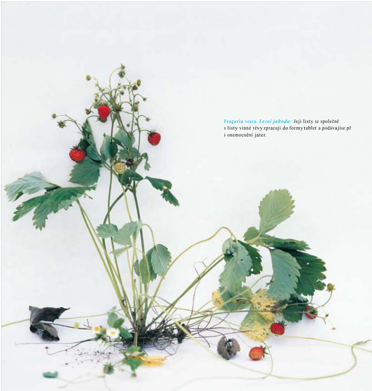
Fragaria vesca. Lesní jahoda: Její listy se společně s listy vinné révy zpracují do formy tablet a podávají se při onemocnění jater.