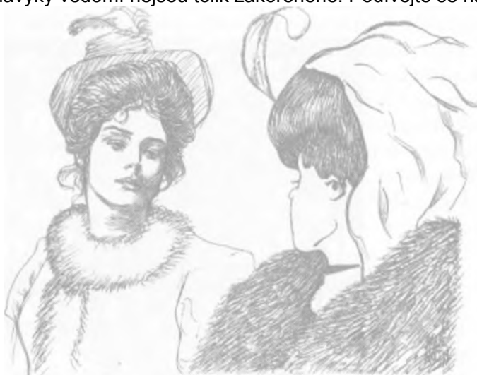
Měním se na svou matku

Jiné návyky vědomí nejsou tolik zakořeněné. Podívejte se na druhý obrázek.