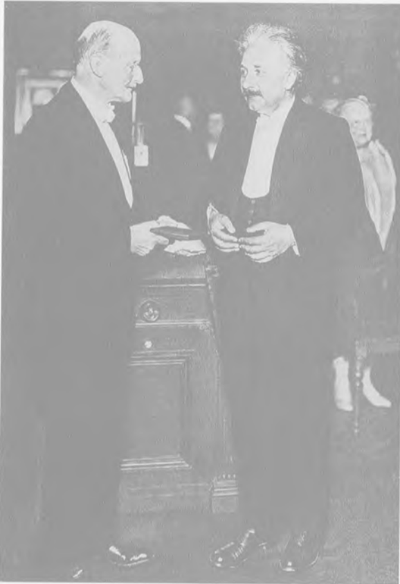
Albert Einstein dostává v roce 1929 od Maxe Plancka Planckovu medaili.

správnou. Huygens, Euler, Fresnel, Faraday, Maxwell — cožpak jejich úsilí nakonec nevyvrcholilo mimořádně úspěšným pohledem na světlo jako na elektromagnetickou vlnu? Podporovaly ho nejen pokusy s interferencí viditelného světla, ale také pokusy s mnohem delšími vlnovými délkami, včetně nově objevených infračervených a rádiových vln. Einstein se nezalekl a jak sám napsal, „neustále se zabýval neuvěřitelně důležitou a obtížnou“ otázkou složení světla. Jeho zkoumání ho vedlo k přesvědčení, že „další fáze vývoje teoretické fyziky nám přinese teorii světla interpretovaného jako druh syntézy vlnové a emisní [částicové] teorie“.