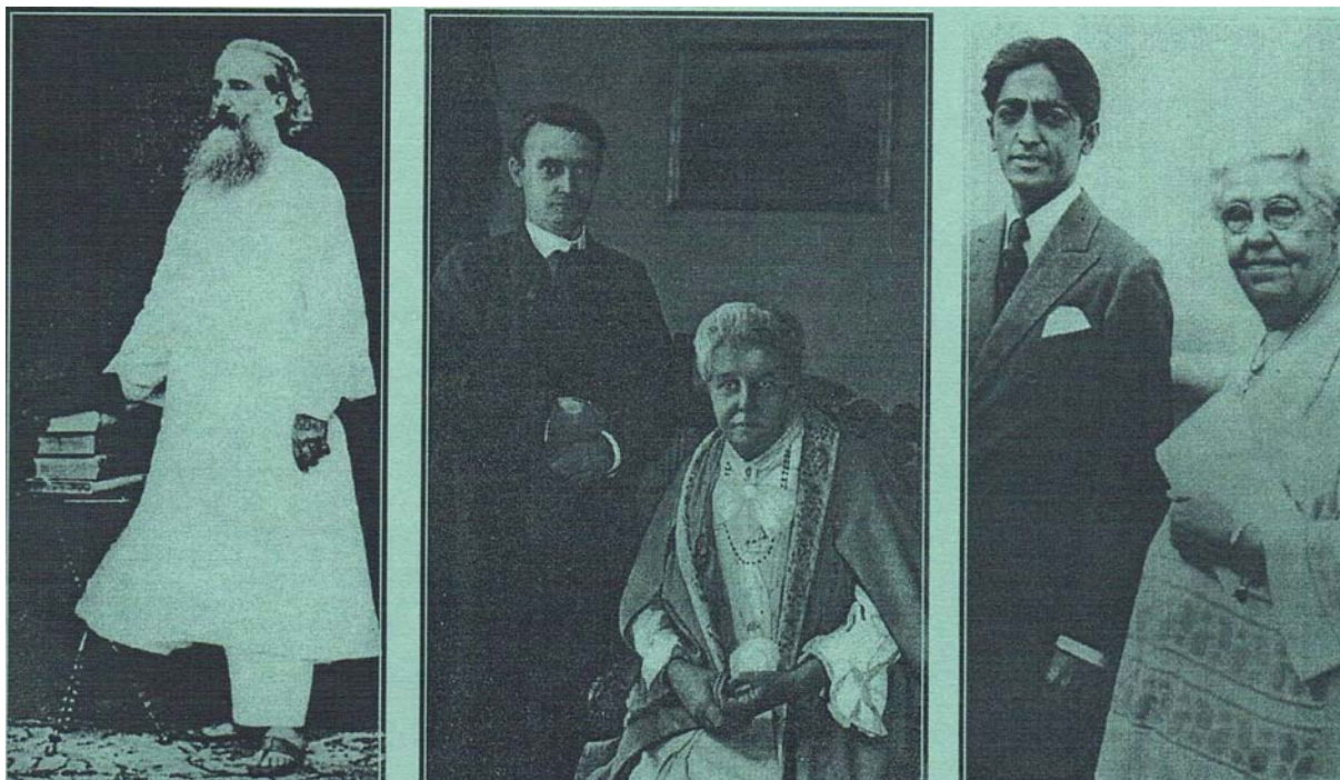
Vlavo: Henry Steel Olcott , jeden z prvých členov teozofickej spoločnosti a celoživotný priateľ madame Blavatskej, India 1883. V strede: Rudolf Steiner s Annie Besantovou v Mníchove, 1907. Vpravo: Annie Besantová a Džiddu Krišnamurti , ktorý teozofiu neskôr odmietol.

Besantové, která uvádí datum narození Ježíšova na r. 105 př. Kr. "za konsulátu Publia Rutilia Rufa a Gnaea Mallia Maxima".