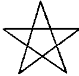
Third Logos Microcosm