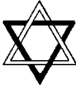
Second Logos Macrocosm