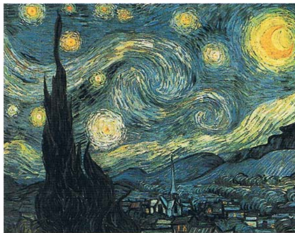
Vincent van Gogh, Hvězdná noc, 1889 (Museum of Modern Art, New York).

Barvy se totiž pohybují například na komplementárních stupnicích oranžová - modrá, zelená - červená a fialová - žlutá. Stojí-li vzájemně proti sobě, stupňují se. Mísí-li se, tlumí svou sílu nebo se zcela ruší - tak jako u ohně v popelu - v prostřední šedé.