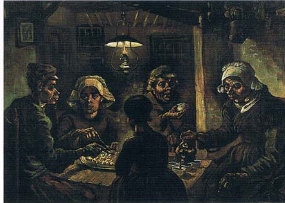
Vincent van Gogh, Jedlíci brambor, 1885 (Rijksmuseum, Amsterdam).