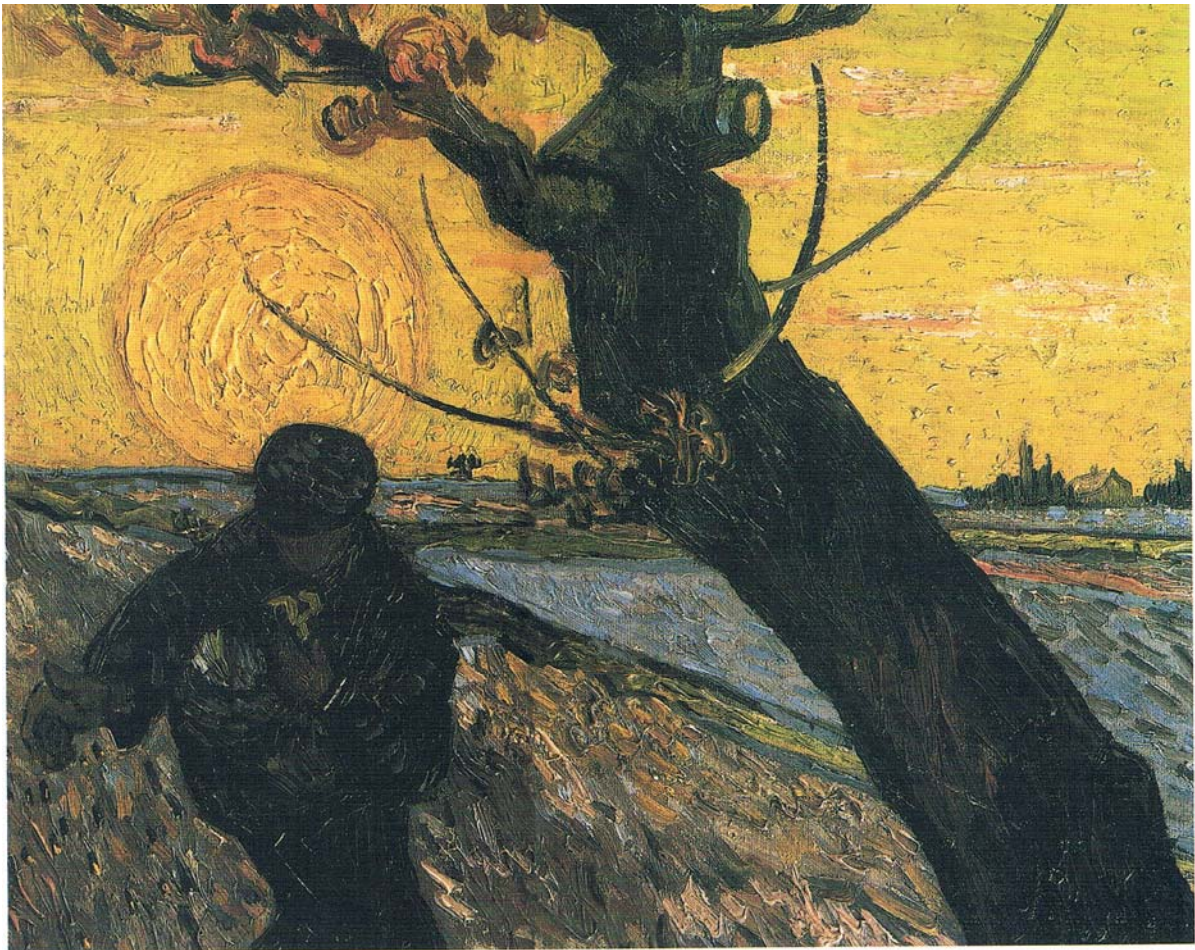
Vincent van Gogh, Rozsévač při zapadajícím slunci, 1888 (Rijksmuseum, Amsterdam).

V „Rozsévači“ namaloval Slunce a Zemi. Rozsévač a strom se stávají prostředníky těchto světů. Vnést Slunce do Země (rozsévač), pozvednout pozemskost ke Slunci (strom), to je prakřesťanský motiv. Obraz však vyjadřuje i utrpení (dosud) nespasené Země. Světlo září do temnoty, ale temnota to (dosud) nepochopila. Vincent van Gogh je uctívačem Slunce i Země. Slunce i Země stojí ve středu stvoření.