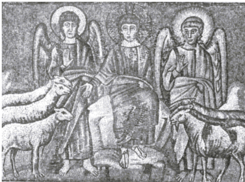
KRISTUS ODDĚLUJE OVCE OD KOZLŮ. S. Apollinaire Nuovo (6. století)

Lidstvo se tváří v tvář setkalo s otevřením bezedné propasti a s andělem, jenž je jejím králem. Oběť svědků však přemohla jeho moc. To, co je ve Městě člověka na zemi trvalé hodnoty, je zachráněno a potvrzeno pro budoucnost, zatímco to, co má jen dočasnou hodnotu, je pohlceno při velkém zemetřesení. Bezedná propast, úklady zdola byly poznány a Nebeský chrám se otevřel. Když se překonávají nebezpečí zdola, je slib shora uveden ve známost. Z Božího