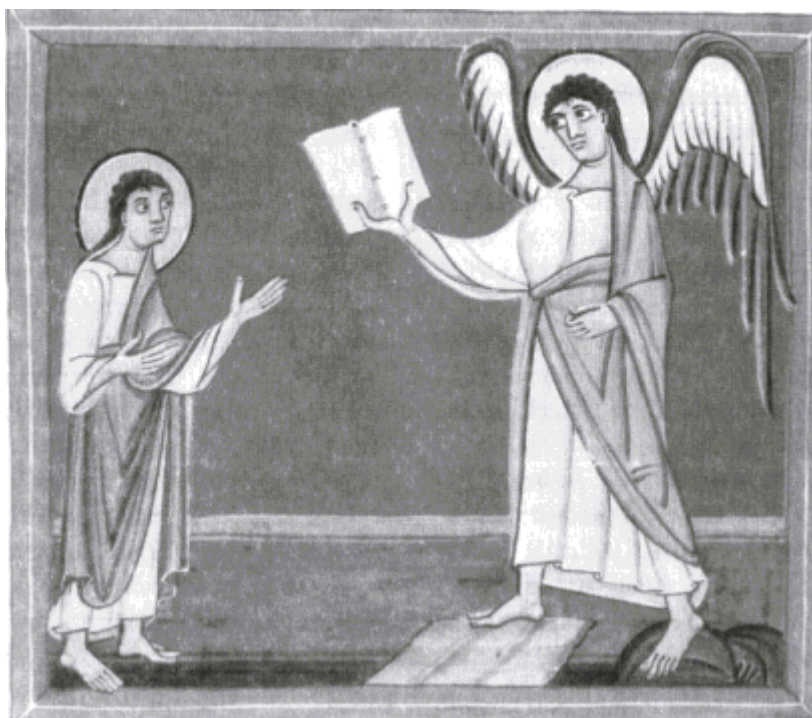
ANDĚL S KNIHOU. Bamberský rukopis.

Jakmile zatroubí šestý anděl a tím uvolní své síly, je vypuštěna ještě mocnější armáda ničivých bytostí. Pohlcují ohněm vycházejícím z jejich úst a zabíjejí uštknutím hadů, což jsou jejich ocasy. Ničivá moc andělů se uvolnila nedbajíc žádného vesmírného omezení. Ve dvacátém verši 20. kapitoly čteme stížnost na to, jak zbytek lidstva, který nebyl zničen tou ohromnou ničivou katastrofou, nejde do sebe, nekaje se, nýbrž dál uctívá své oblíbené a neužitečné modly. Ničivá bouře napadla bytí lidí na zemi a oni se jí nemohou bránit, neboť je zcela přemohla. Vypadá to, že se nezúčastňují aktivně toho, co se děje, ale že jsou jen oběťmi. V takové situaci, jež je tolik vzdálená lidským silám, se lidské duše nemohou učit ze zkušenosti, mohou pouze trpět.