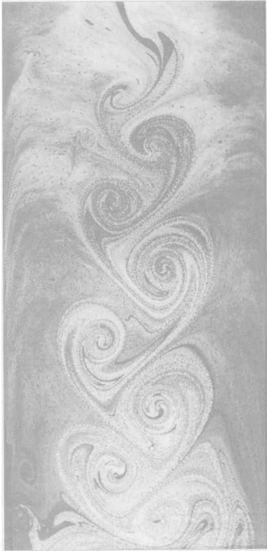
Karmanova vírová stezka