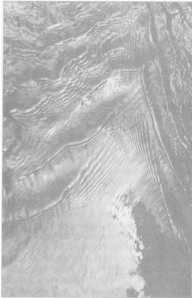
Kapilární vlny na hladině potoka