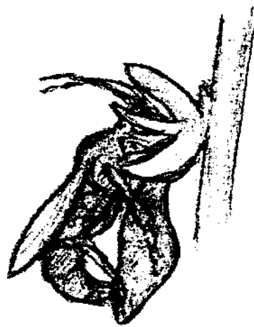
Sameček kutilky rodu Argogorytes opyluje květ vstavače kopulací