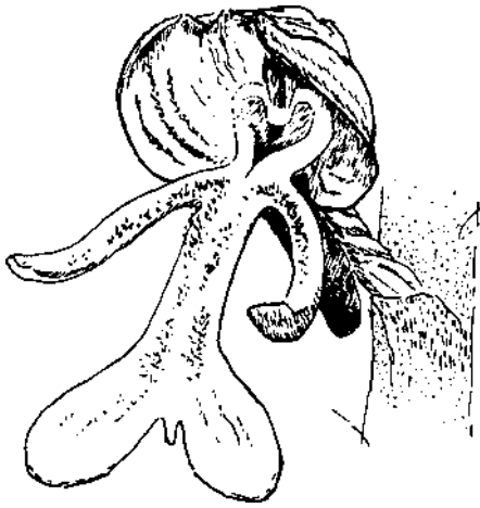
Zvětšený květ vstavače vojenského ( Orchis militaris ); podle: Bertold Heyden, Zum Wesensverständnis der Getreidepflanzen, s. 33