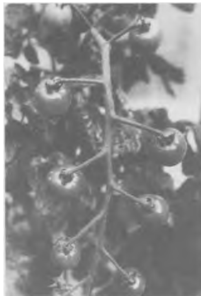
Rajčatová rostlina, která nemá ve stonku dost síly, aby se udržela vzpřímená

Má se za to, že slovo „solanum“ pochází z latinského sofamen, což znamená