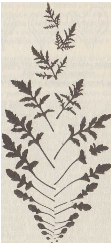
Obr. 2: Postupný vývoj formy listů vlčího máku ( Papaver rhoeas )

dokonce na znetvořenině, zpola zeleném a zpola červeném listě pod květem,