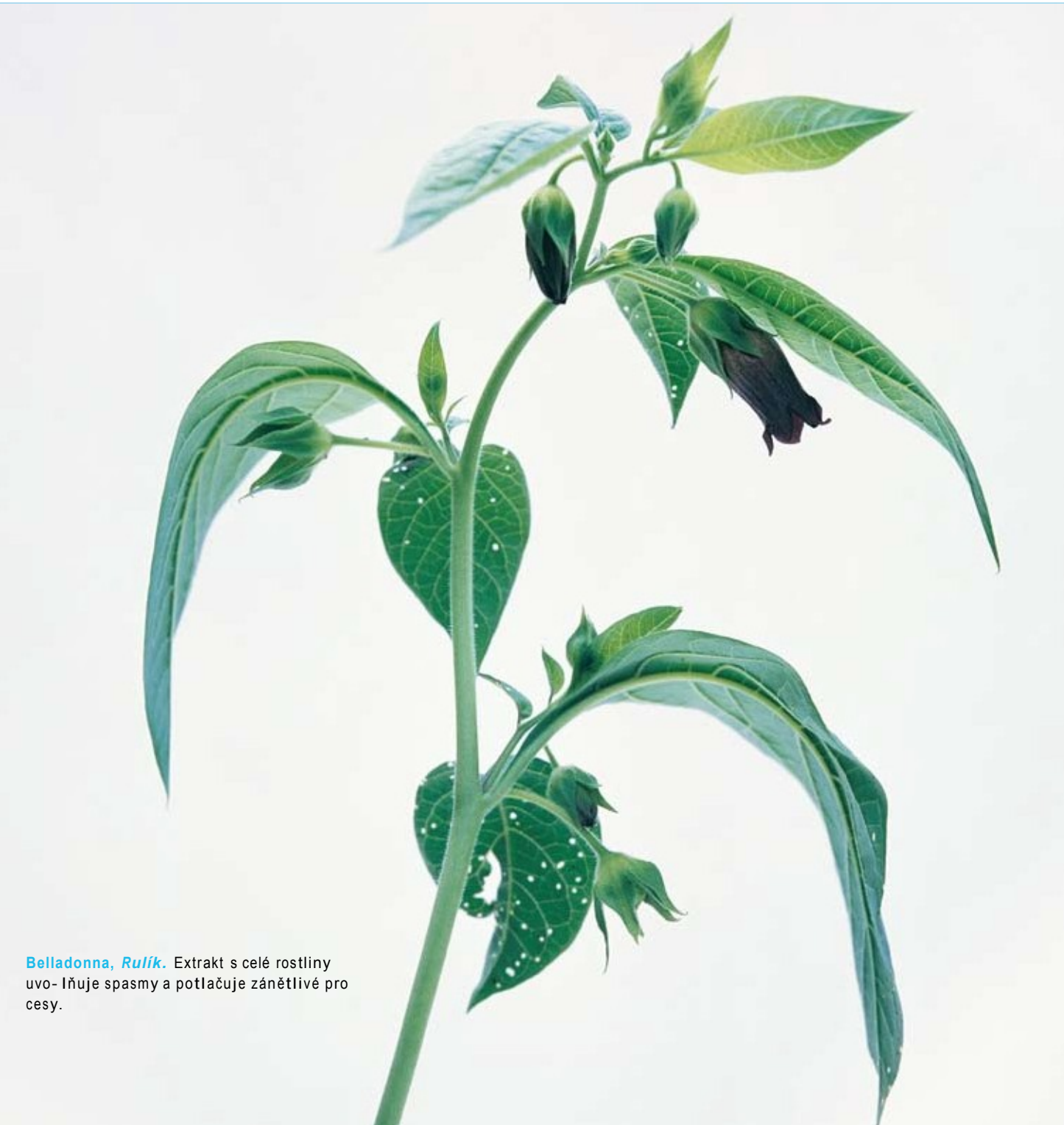
Belladonna, Rulík. Extrakt s celé rostliny uvo- lňuje spasmus a potlačuje zánětlivé procesy.