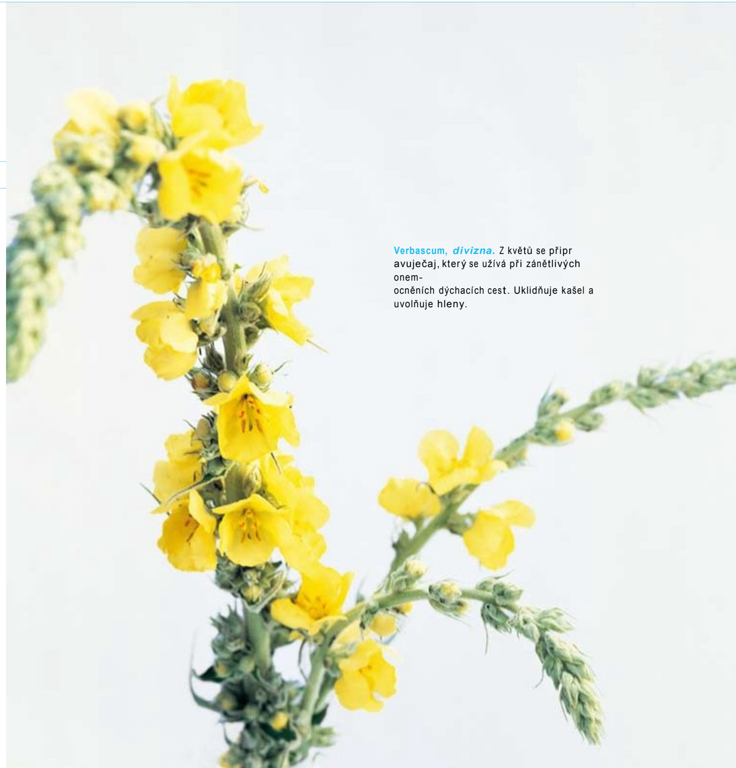
Verbascum, divizna. Z květů se připravuje čaj, který se užívá při zánětlivých onemocněních dýchacích cest. Uklidňuje kašel a uvolňuje hleny.

Nemocí se dostává člověku možnost rozpoznat narušenou rovnováhu, ze které se tělem i duší vychýlil. Dostává šanci pochopit výchylku a pomocí terapie najít opět novou rovnováhu, často na vyšší úrovni. Chronické onemocnění mu nabízí možnost naučit se nové schopnosti, nové způsoby jednání a dává naší osobnosti možnost zrát. Antroposofický lékař podporuje svého pacienta právě tímto směrem. Posiluje jeho zodpovědnost za sebe, uznává jeho svéprávnost, podporuje jeho právo na rozhodování při volbě terapie, a posiluje ho v jeho snaze udržet si své zdraví.